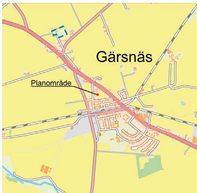
Översiktskarta över Gärsnäs med planändringens lokalisering markerat med rött.