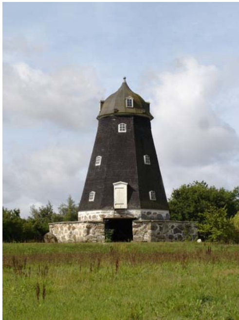
Retuscherat foto, utan vingar, 2008-08-30