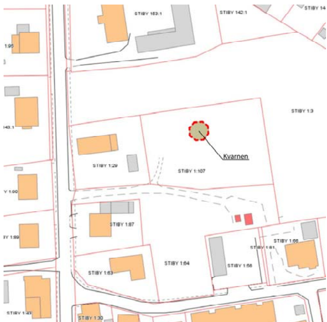
Översiktskarta över kvarnen. Planändringens lokalisering inom fastigheten Stiby 1:107 är markerat med rött.