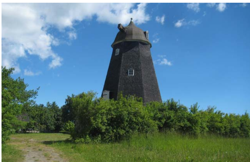
Fotografi, 2013-06-10, på kvarnens nuvarande gestalt när vingarna har monterats ner.

behöva ersättas med nya. Vingarna är tills vidare nedmonterade för att inte utgöra en fara för allmänheten. Enligt gällande detaljplanen ska det vara möjligt att omvandla kvarnen till bostad med mindre hantverks verksamhet och tillhörande handel i mindre skala, samtidigt föreskriver detaljplanen att kvarnens vingar ska finnas kvar (genom skyddsbestämmelsen q). Detta innebär att utrymmet som är tänkt till bostadsyta inskränks av tekniska delar som motvikt för att hålla vingarna på plats. För att underlätta användandet av kvarnen som bostad bör kravet på att vingarna ska bevaras, del av skyddsbestämmelsen (q), upphävas.