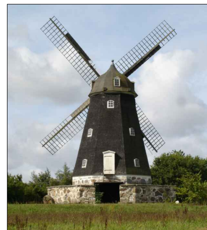
Kvarnens dåvarande gestalt, foto 2008-08-30, med vingar skyddade med planbestämmelsen q i gällande detaljplan, laga kraft vunen 2010-03-26.