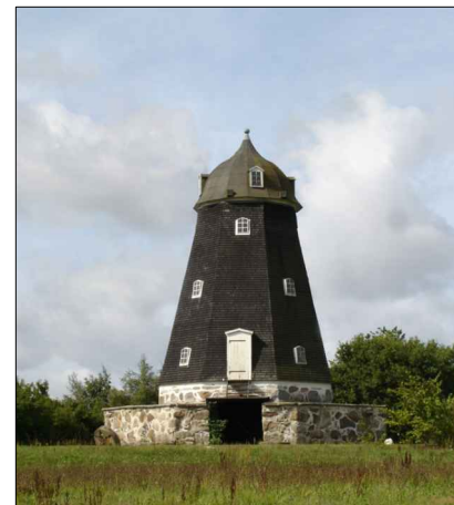
Kvarnens nuvarande gestalt utan vingar, retuscherat foto 2008-08-30. I ändringen av detaljplanen upphävs skyddet att vingar ska bevaras (planbestämmelsen q).