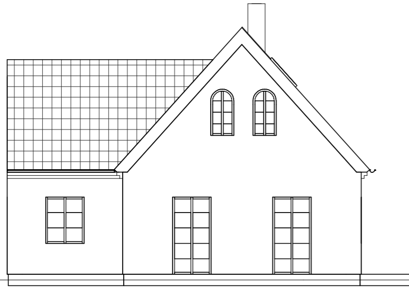
FASAD MOT NORR 1 : 100