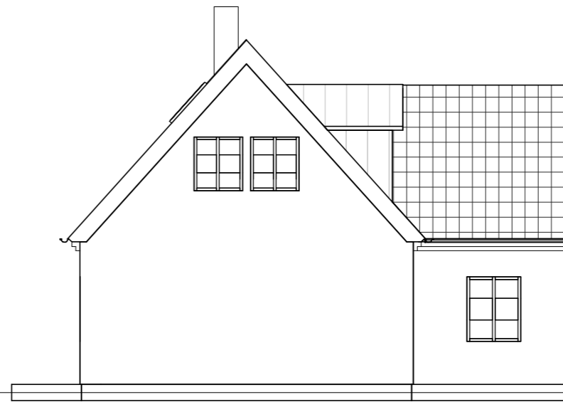
FASAD MOT SÖDER 1 : 100