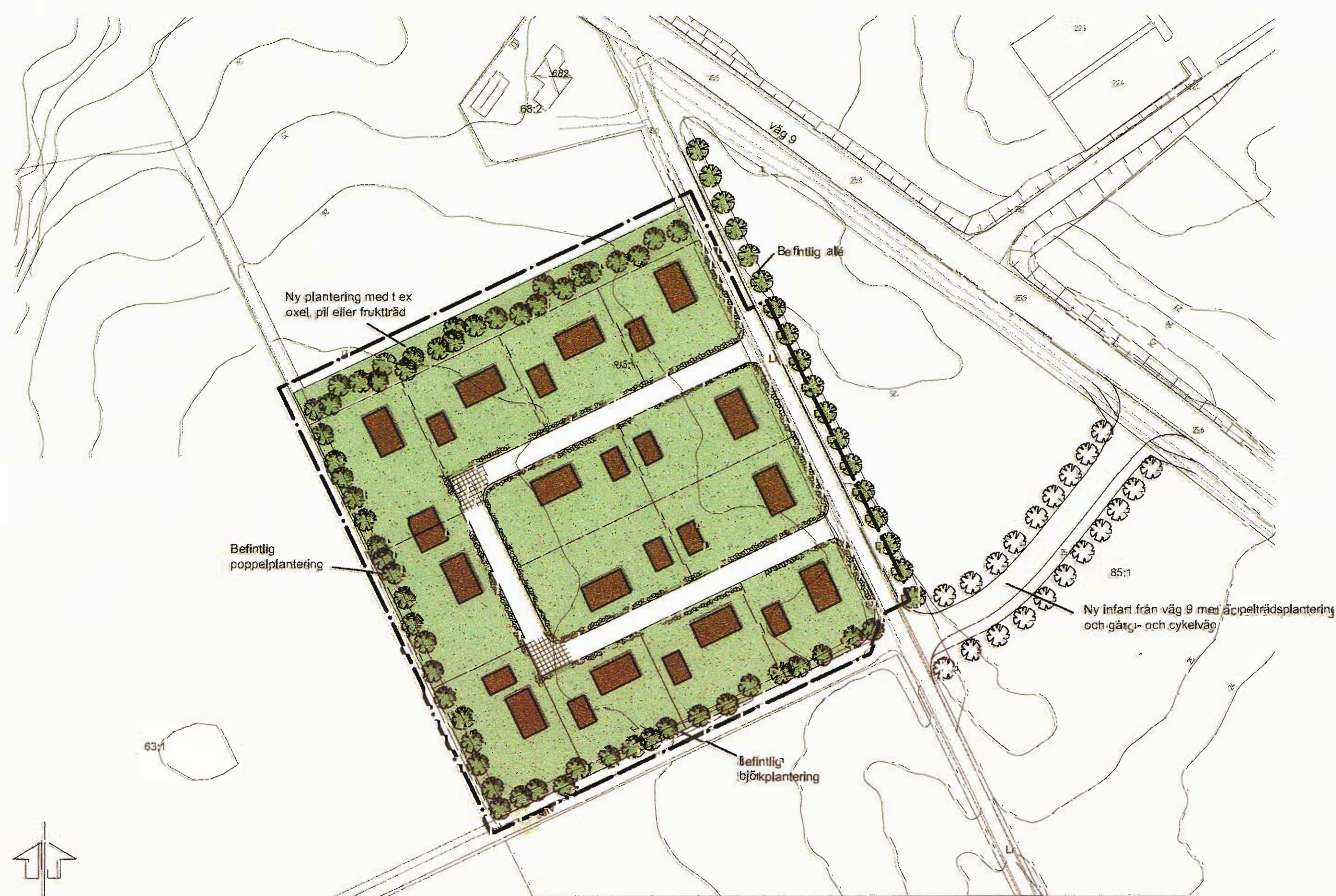
ILLUSTRATIONSKARTA skala 1:1000